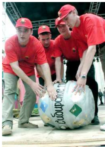
№ 1 из 1 - купить фото

Приангарье, входящее в тройку самых пьющих регионов Сибири, внезапно сократило потребление алкоголя. По официальной статистике, за 2011 год продажа горячительных напитков снизилась в среднем на 2,3%. Особенно отличилась слабоалкогольная продукция, которая потеряла сразу 30%. Казалось, на динамику повлиял запрет на реализацию алкоголя после 23 часов. Однако продавцы отрицают изменения на алкогольном рынке, утверждая, что вопреки новым ограничениям пьют жители региона прежними темпами. Почему падают продажи, а не потребление, попыталась разобраться Елена ПОСТНОВА.